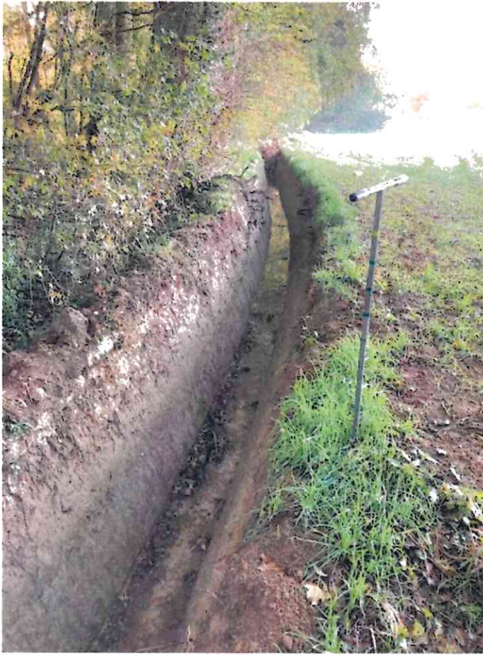
Fossé drainant en limite Est de la parcelle N° 1395. Il devra être rebouché sur 134 ml.